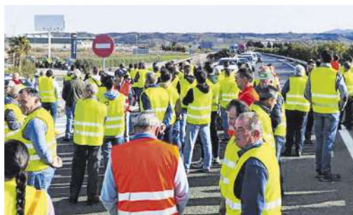
Las protestas se concentraron en el interior.

Juanma Moreno expresa su solidaridad con el campo andaluz y pide al Gobierno central «medidas valientes»