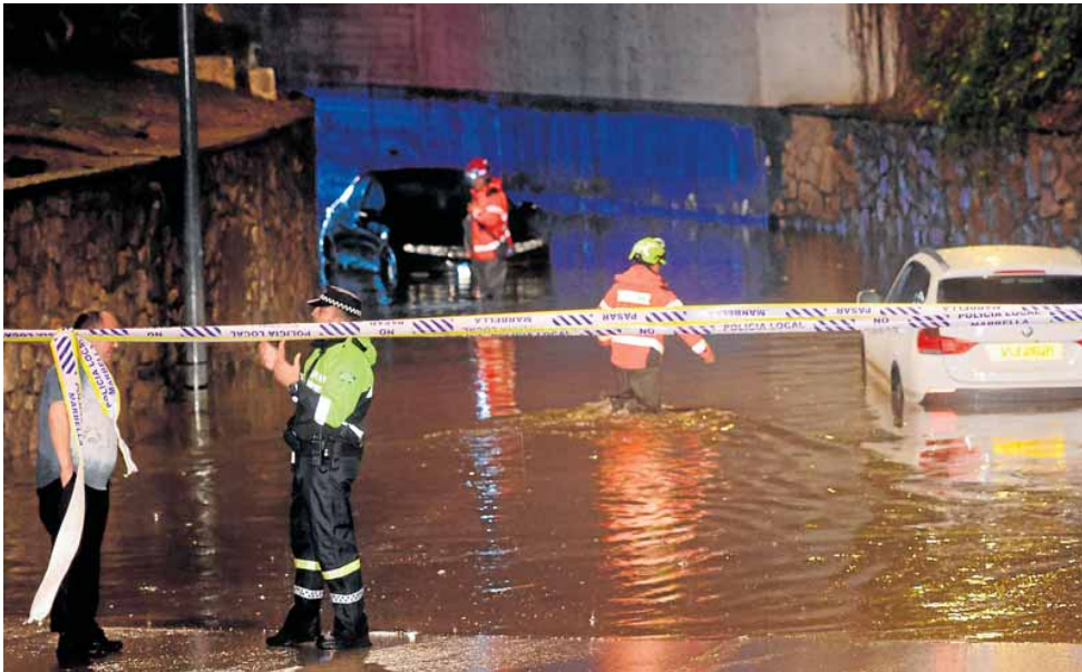
Estado del acceso a Puerto Banús en torno a la medianoche del lunes.

«En Málaga hacen falta inundaciones para paliar la sequía, y no se han producido», afirma el presidente de Asaja