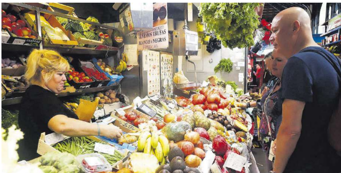
Uno de los muchos puestos de frutas y verduras que podemos encontrar en el mercado de Atarazanas del casco histórico de la capital malagueña.