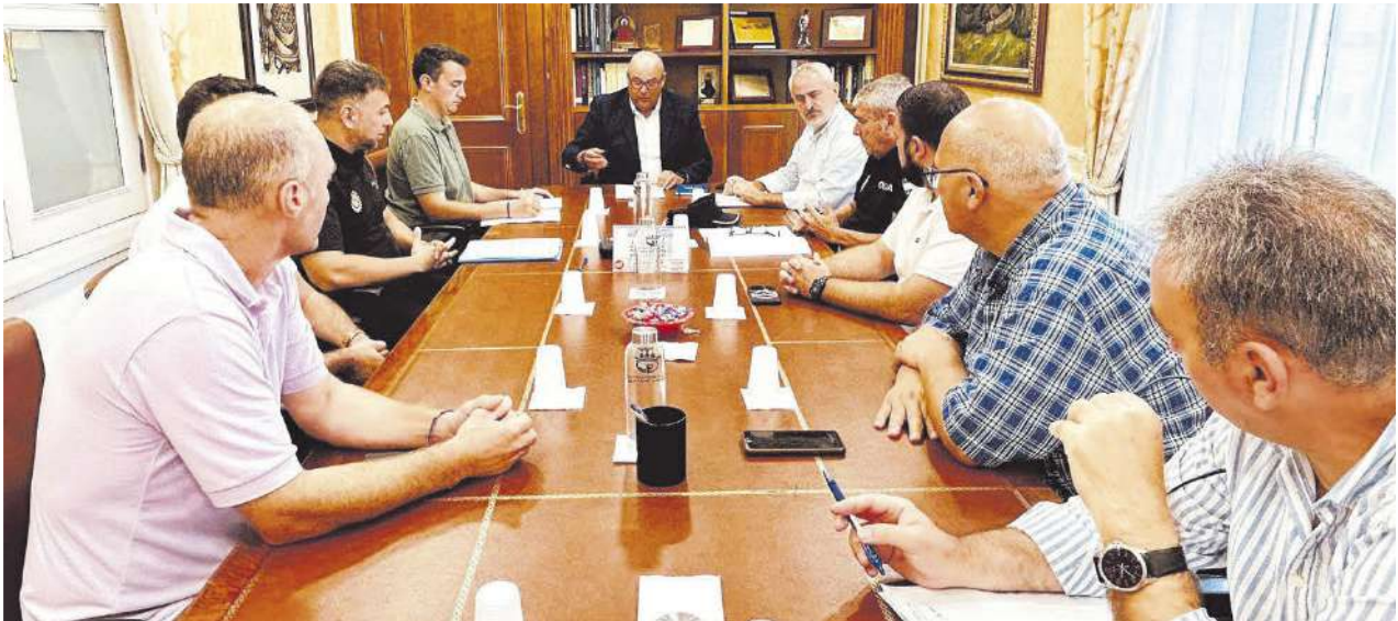
Vélez-Málaga acogió ayer lunes el primer encuentro con presencia de agentes y de organizaciones agrarias.