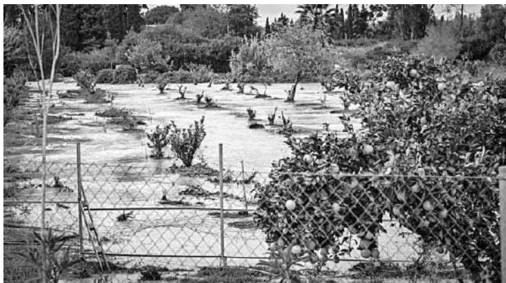
Explotación de la campiña jerezana totalmente inundada.