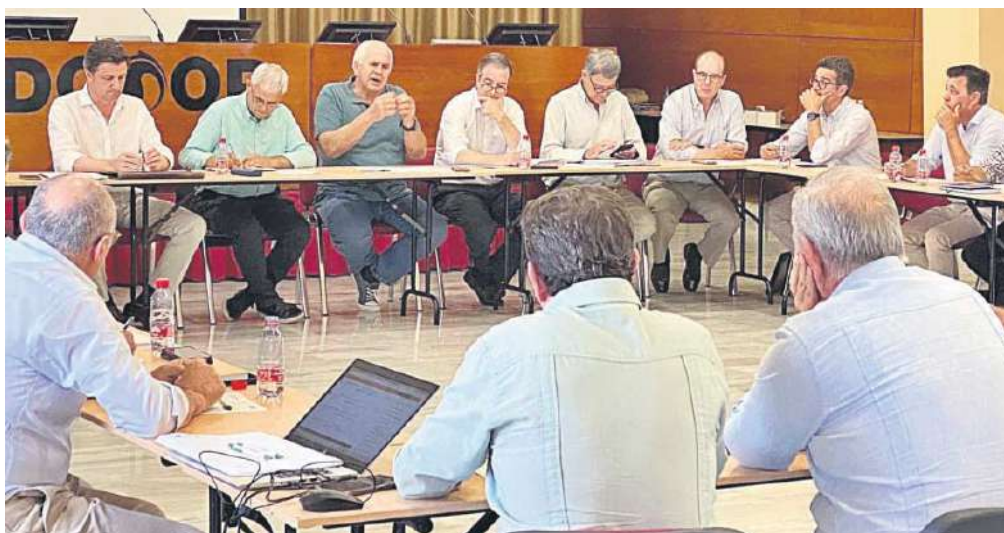
Un momento de la reunión.