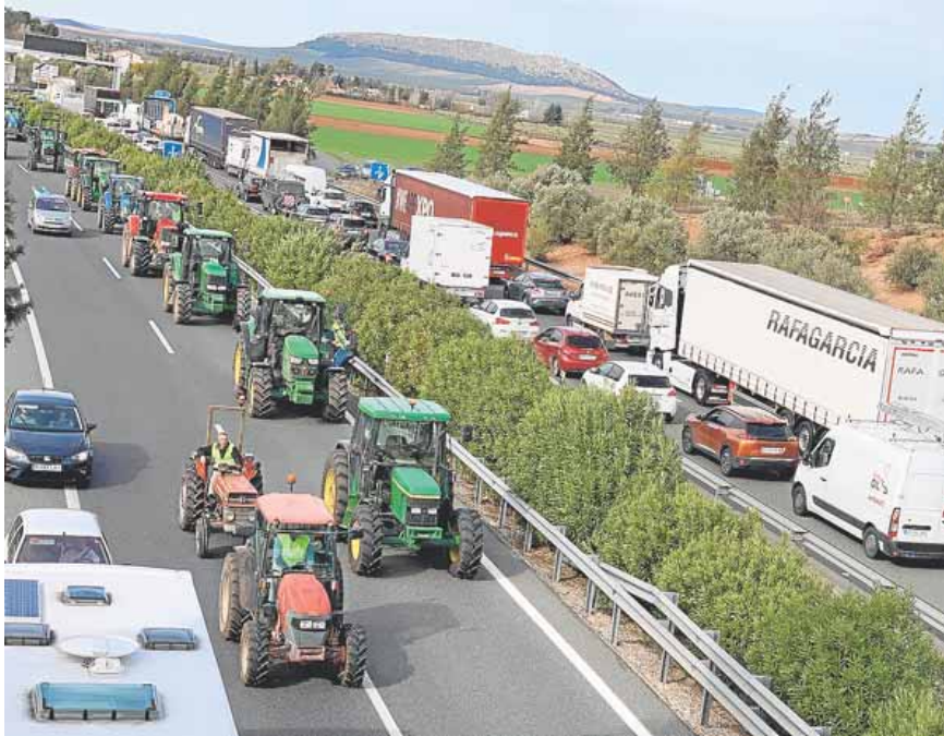
El cruce de El Faro fue el lugar de encuentro de los 200 tractores que cortaron la A-92. A. J. GUERRERO