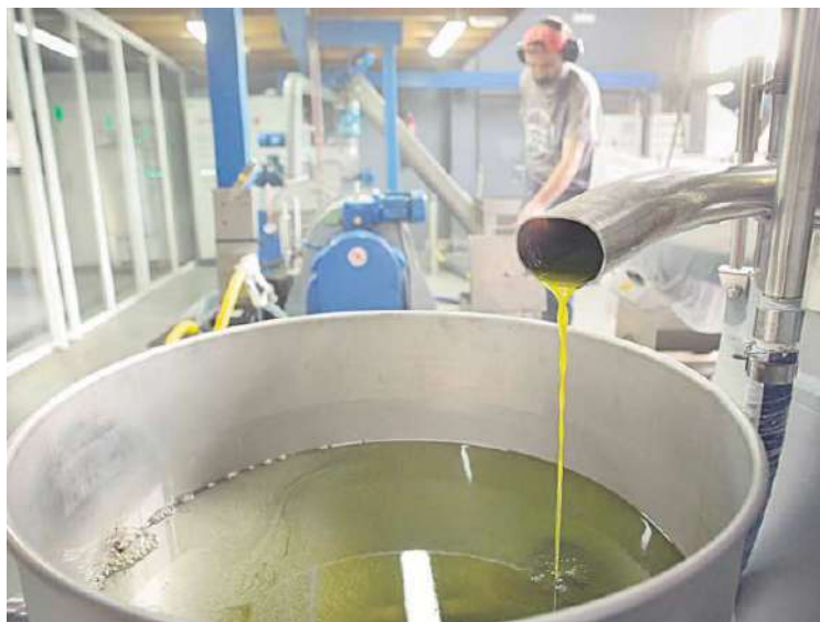
Producción de aceite de oliva en una almazara.