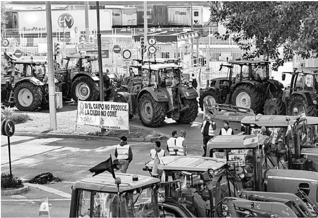
ganaderos y agricultores han protagonizado sucesivas manifestaciones en Málaga en los últimos meses.