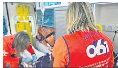
Sanitarios en una imagen de archivo.

Los sanitarios desplazados al lugar del suceso confirmaron al 112 el fallecimiento de un varón de 66 años. No trascendieron más datos sobre las circunstancias en la que se produjeron los hechos.