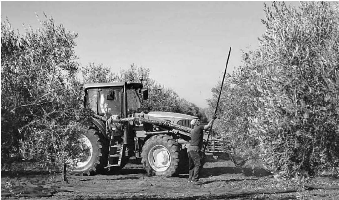
na cuadrilla recoge aceitunas.