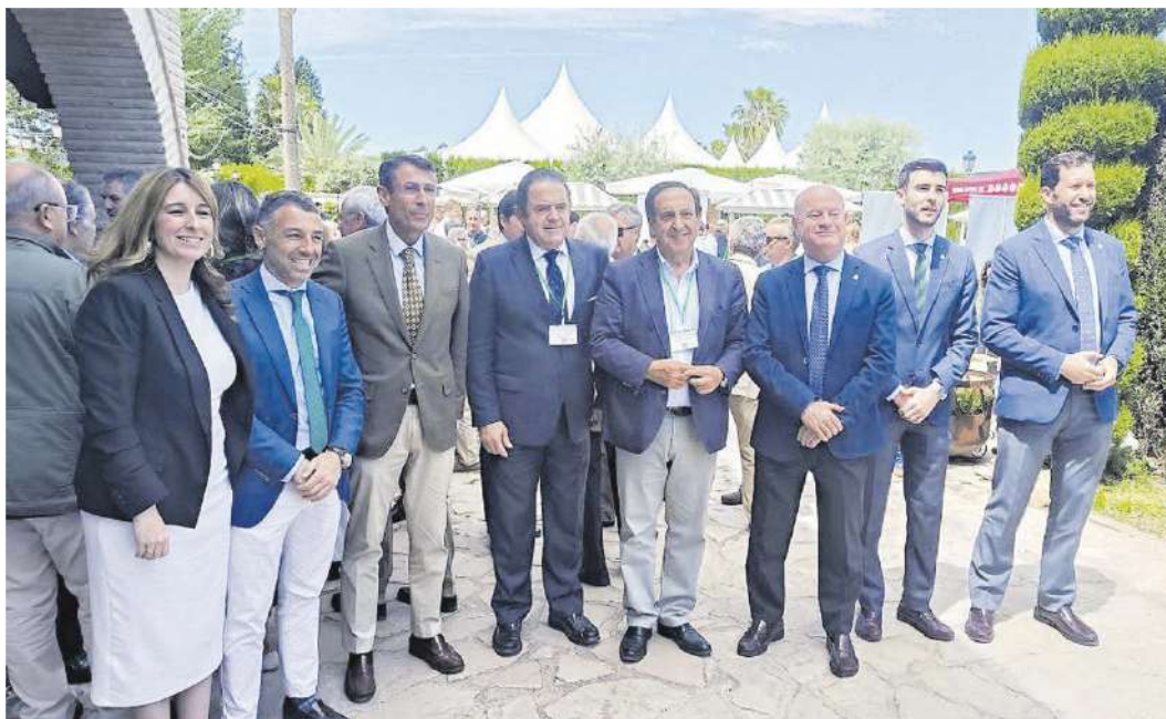
Responsables de Asaja con dirigentes municipales y autonómicos, ayer.