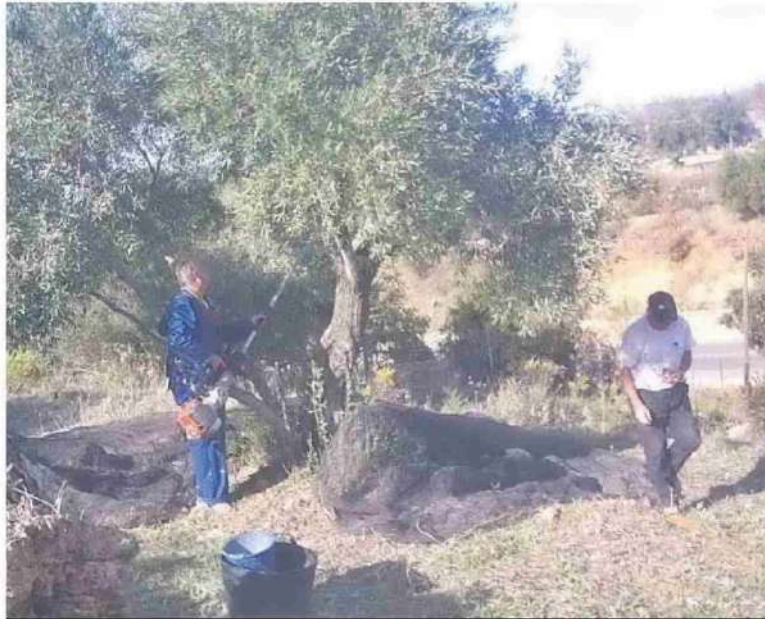
Un agricultor en plena faena en el olivar.

En cuanto al balance propio, dice, la agricultura concluye el año con una facturación de 541,52 millones, un 6,58%