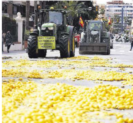
Tractores y agricultores en el Paseo de Sancha de la capital malagueña.