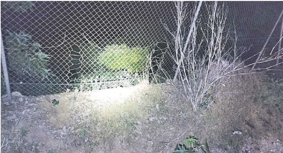
Alambrada de una parcela en la que han robado en Vélez-Málaga.

● Los ladrones son impredecibles y actúan a cualquier hora del día y con diferentes métodos, afirman los vecinos