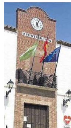
Fachada del Ayuntamiento.

Este sector de terreno cuenta con más de 20.000 metros cuadrados y de la misma resulta un par-