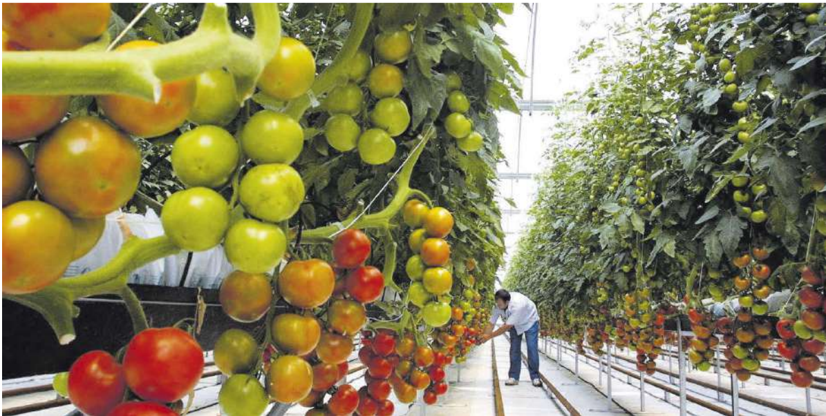
La Axarquía se ha mantenido durante medio siglo como auténtica despensa hortofrutícola de la provincia, gracias a la modernización de sus invernaderos.