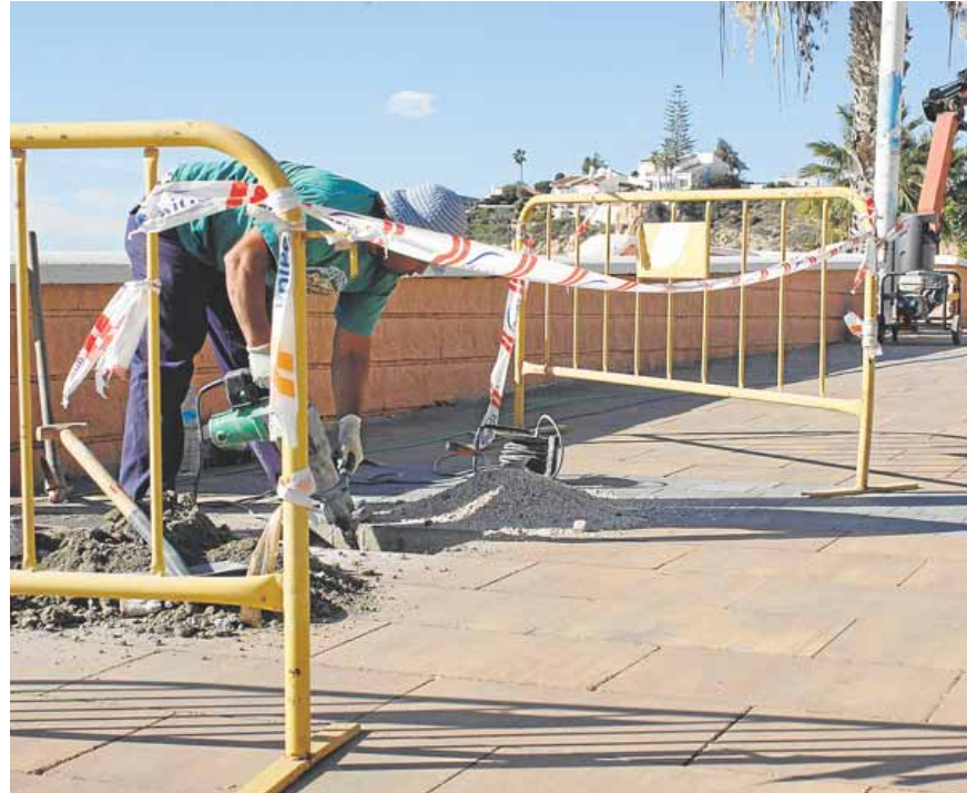
Trabajos de remates de la obra de la tubería, en el paseo marítimo de Rincón, el pasado noviembre.

Los productores de subtropicales axárquicos se tomaron con «resignación» que el 1 de diciembre de 2017 se les recortara el suministro que les llegaba de La Vi-