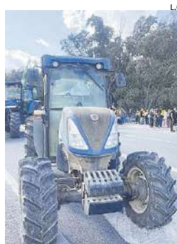
Tractorada en el Guadalhorce.

Los colectivos agrarios mantienen su lucha «por la dignificación y supervivencia del mundo rural» y reiteran, como ya señalaban horas antes a través de estas mismas páginas, que seguirán en sus protestas «mientras no se consiga algo por escrito. El campo ha dicho basta ya y vamos a estar en la calle. Las movilizaciones continúan, no solo aquí en Málaga y Andalucía, sino en toda España, y