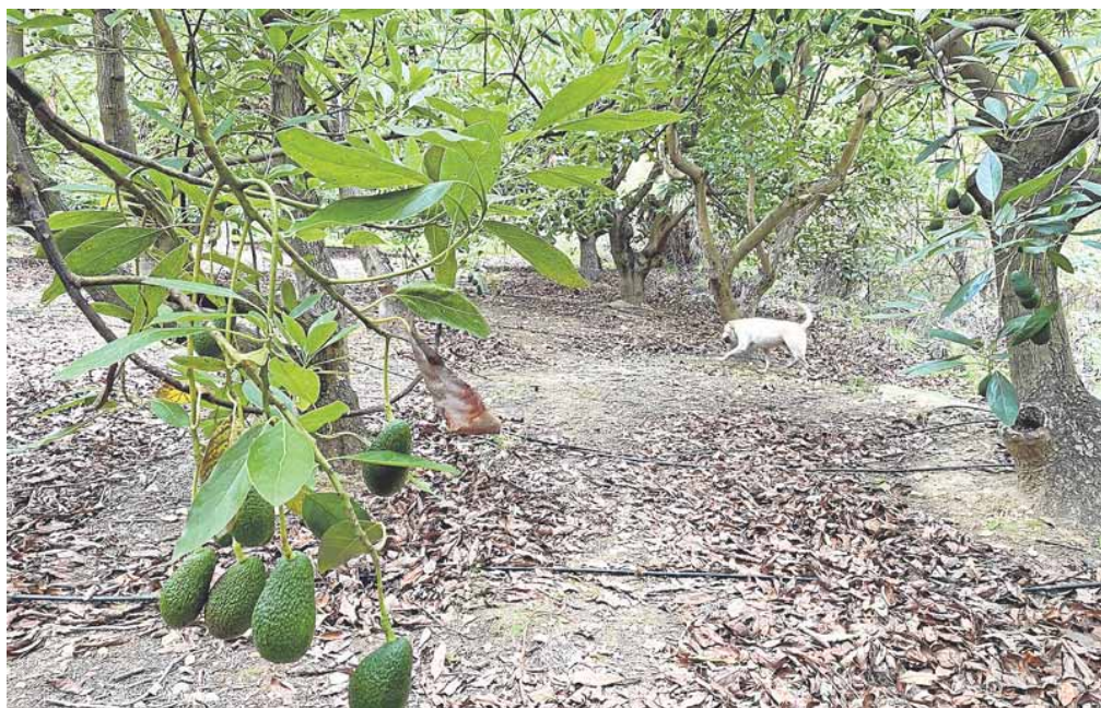
La imagen muestra una plantación de aguacates en la Axarquía. EUGENIO CABEZAS

En un espacio de tiempo muy corto, uno de los sectores agroindustriales más desarrollados en Andalucía, ha retrocedido diez años. Así lo afirma la asociación agraria Asaja en el balance para el 2023. Un documento, plagado de datos negativos, que se lee como una planifera para el campo malagueño. Ningún cultivo