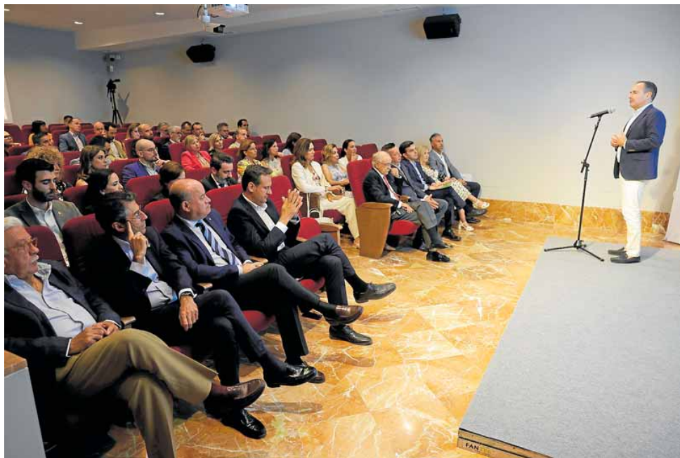
Castillo interviene ante premiados, organizadores, patrocinadores y colaboradores de esta edición en el Museo de la Ciudad de Antequera. NIÑO SALAS

En concreto, los cinco premios fueron Aguilar Explotaciones y su marca Pistachos Nazaries, en la categoría de Producción y Desarrollo Local; Grupo San Roque, en la modalidad de Expansión y Crecimiento; Faccca Prolongo, en la categoría de Innovación; Aceites El Niño, en la modalidad de Trayectoria Empresarial; y Frutas y Verduras Eladio, como Premio Local.