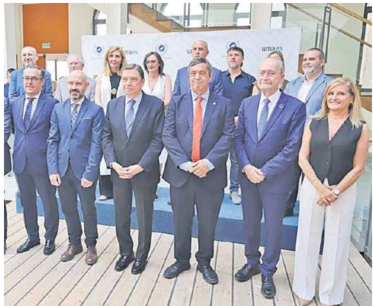
Foto de familia de las autoridades.

En este sentido, y a pesar de que insiste en que la cuestión es competencia autonómica, desde el ministerio preparan un catálogo con medidas para favorecer la incorporación de jóvenes a esta actividad. Precisamente con este objetivo, puntualizó Planas, la Unión Europea inyecta 200