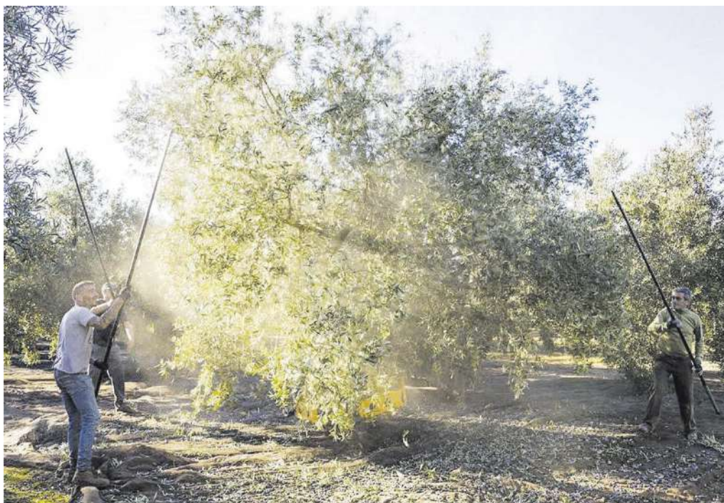
El campo malagueño, en jaque: sin lluvias y con pérdidas económicas.

El sector agrario en la comarca de Ronda, dedicada al cultivo de almendras y castañas, enfrenta problemas adicionales debido a enfermedades persistentes: «Lle-