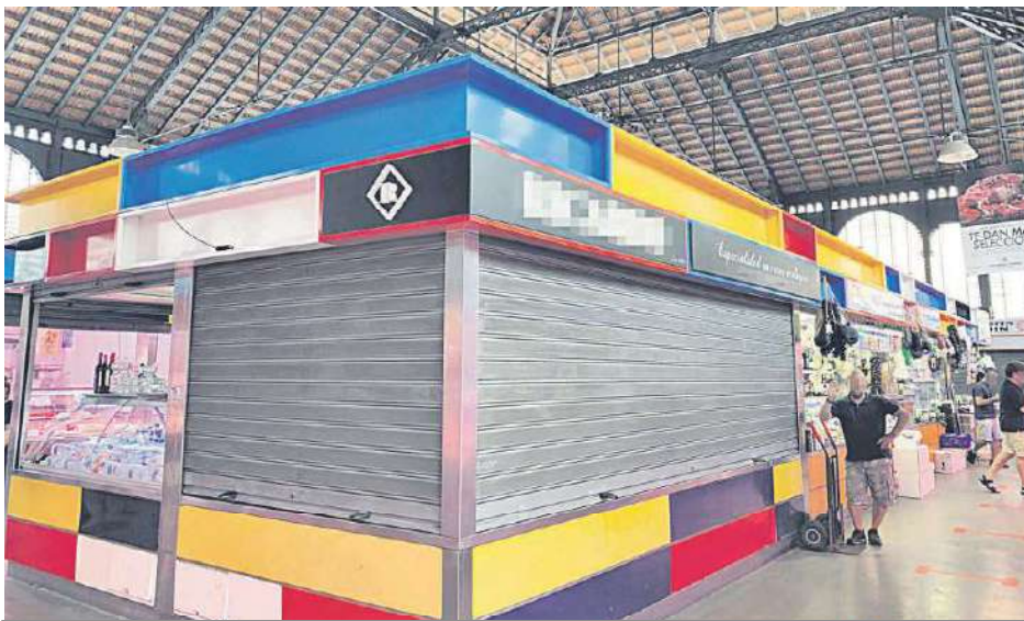
El puesto del carnicero atracado ayer con las persianas bajadas.

● La víctima se dirigía a trabajar cuando supuestamente un individuo encapuchado le robó el dinero del pago a proveedores