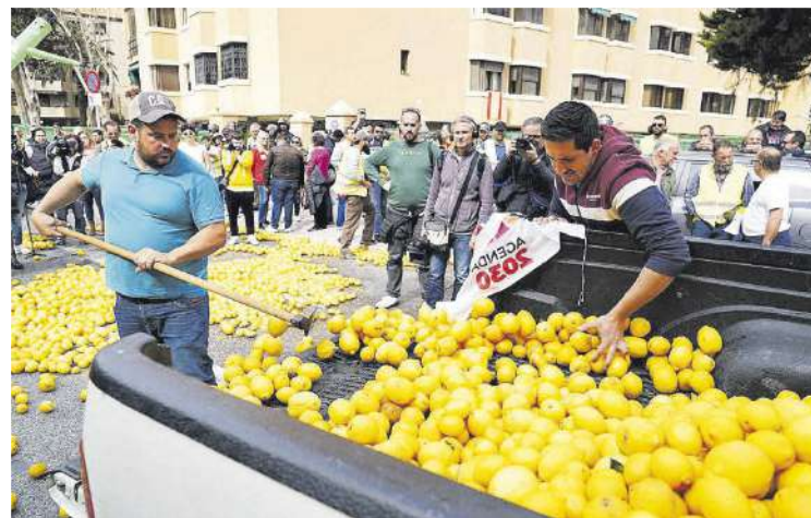
Los agricultores de Málaga tiran limones en protesta por la situación del campo.

► La manifestación, que comenzó de manera pacífica, acabó con los profesionales del sector lanzando limones a las fachadas de la Subdelegación del Gobierno de la ciudad y purines a la puerta del edificio