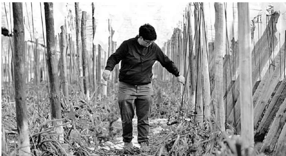
Un agricultor revisa los daños en un invernadero destruido en El Ejido.