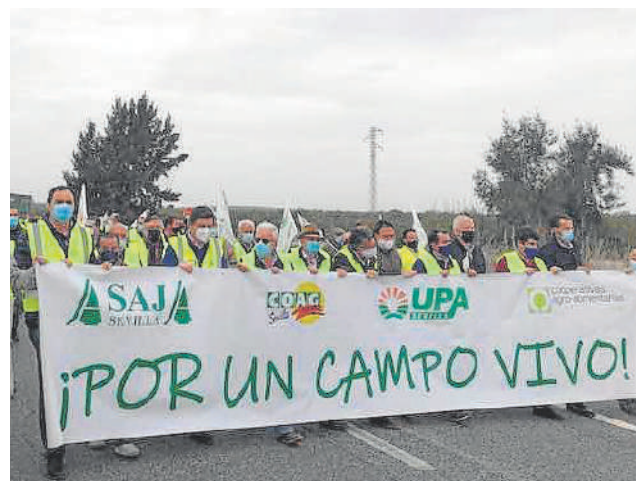
Movilización de agricultores en la AP-4

Por otro lado, piden una flexibilización y simplificación de la actual PAC, y, a nivel nacional, reclaman la modificación y ampliación de la Ley de la Cadena Agroalimentaria para prohibir las prácticas desleales para que los precios de los agricultores cubran los costes de producción.