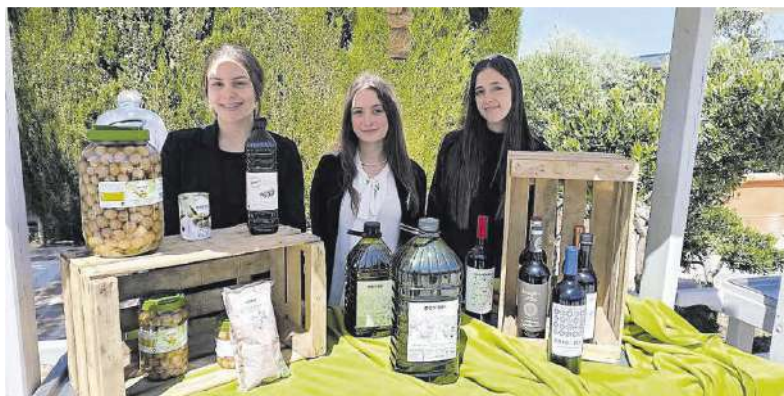
Uno de los expositores presentes en la asamblea de Asaja en Antequera.