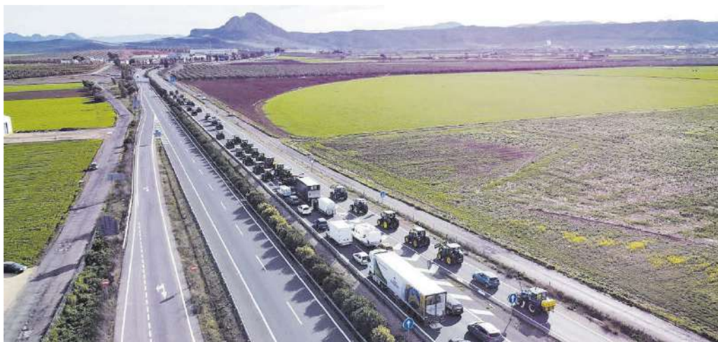
Los cortes en las autovías de acceso a Antequera se prolongaron durante más de ocho horas.

En la autovía A-92, a la altura del punto kilométrico 149, en An-