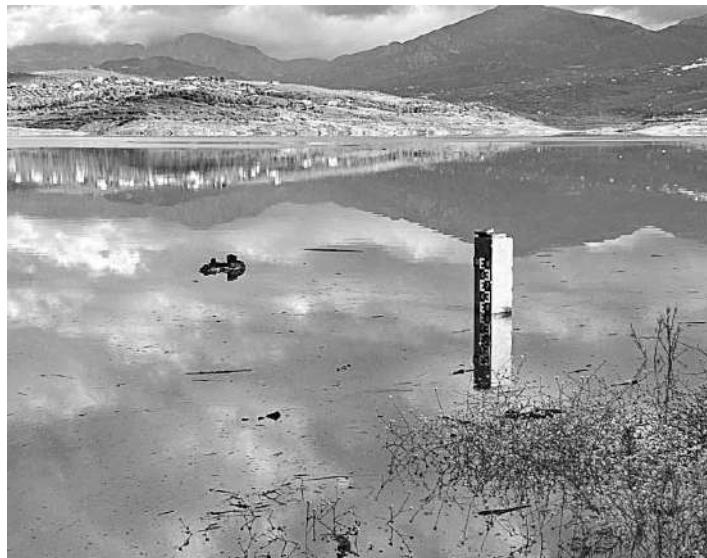
Estado que presentaba ayer el pantano de La Viñuela.

Rodríguez afirmó con la mirada puesta en el futuro que es necesario invertir en sistemas de construcciones hidráulicas para hacer frente a las sequías: "Esperemos que esta primavera tengamos más precipitaciones y que el ciclo de lluvia cambie y sea más normal y regular. Y por supuesto que sigamos elaborando de medidas para afrontar los periodos de escasez". Disponer de infraestructuras de este tipo ayudaría a aprovechar al máximo los pocos recursos disponibles, además de regular el cauce de los ríos y a sacar partido de las aguas regeneradas.