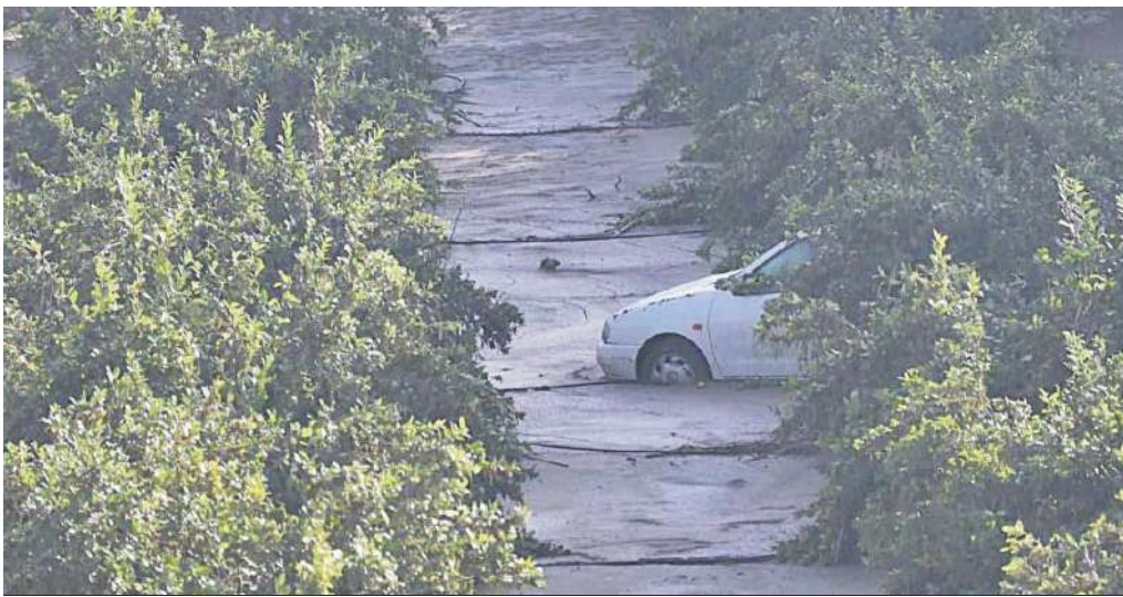
Un vehículo, en un campo de Álora.