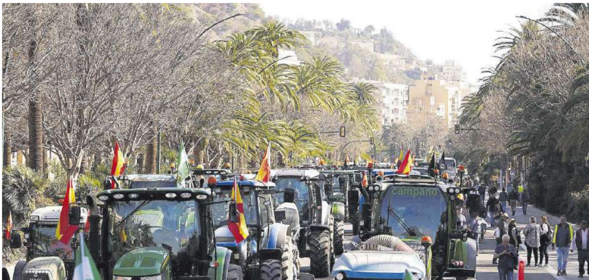
Unos 88 tractores y un millar de personas se movilizaron para exigir medidas.

► El campo denuncia los bajos precios y la competencia «desleal» de terceros países y exige medidas urgentes para paliar «su crítica situación» ► «Sin agricultores ni ganaderos no tenemos nada», claman los profesionales del sector agrario