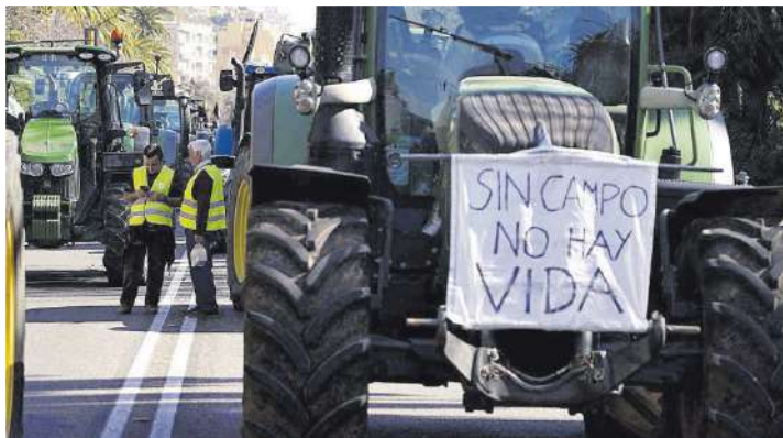
Tractores en el Paseo del Parque de Málaga.

Tractores procedentes de toda la provincia se concentraron a par-