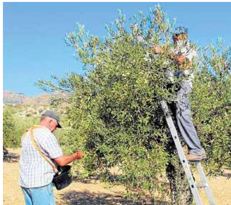
Varias personas durante la recolecta. sur

El municipio de Casarabonela fue el encargado de dar inicio oficial a la campaña el pasado viernes 13 de septiembre. El