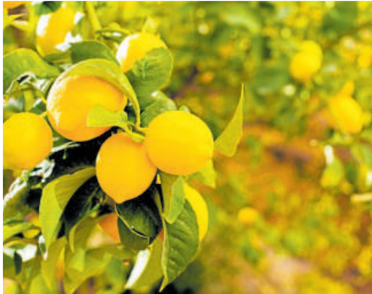
Málaga es la principal provincia productora de este cítrico en Andalucía