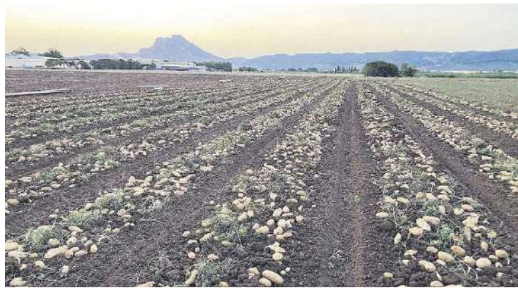
Un campo de patatas.

El alza de los precios se debe a la escasez de producto, pues las intensas lluvias que se registraron en Semana Santa causaron graves daños en los cultivos de patatas de otras zonas productoras del sur de España, como Sevilla, Huelva y Cartagena, donde se produjo una importan-