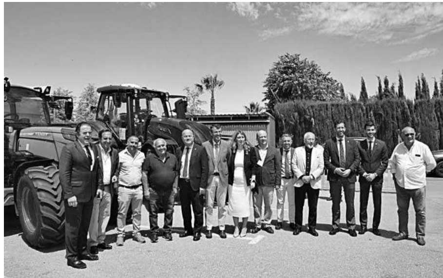
Foto de familia de la asamblea general de Asaja Málaga.