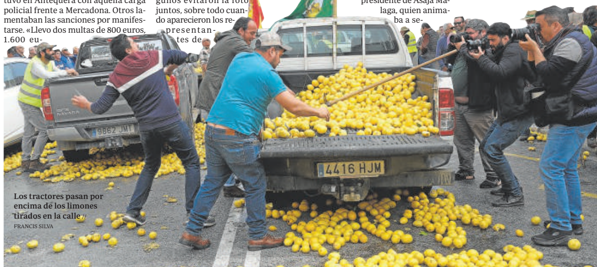
Los tractores pasan por encima de los limones tirados en la calle //

guir movilizándose pero sin crear disturbios. Ese tipo de acciones son las que rechazan las organizaciones agrarias, pero que persiguen los que se identifican con la plataforma 6F.