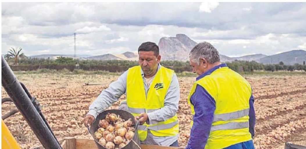
Recogida de cebollas en la vega de Antequera.